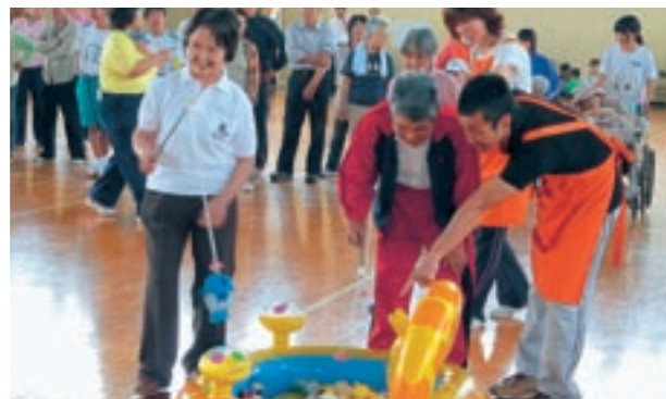
▲6月4日、第5回福祉運動会が開催され、多くの方々が交流を深めました。