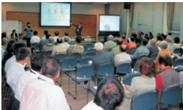
▲5月31日、「おでかけトーク in 植木」が開催され、市長と参加者が意見交換を行いました。