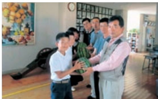
▲5月18日、JA鹿本園芸部会から植木町の各小学校、福祉施設にスイカ・メロンが贈られました。