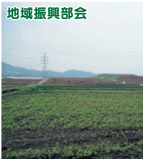
南尾迫地区県営ほ場整備事業