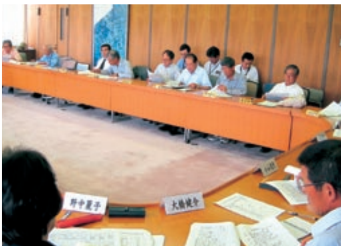
▲5月20日に開催された自治会長代表者会と合併特例区協議会の意見交換会