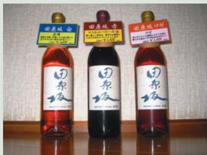
▲植木町の6次産業の事例

これは、平成22年12月3日に農林水産省による6次産業化・地産地消費が公布されてから、県や市も6次産業化の支援の方策を実施しています。国・県・市など各段階で補助金制度があり、市では「熊本市農業わくわく化事業」、「農商工連携推進事業」などがあります。平成24年3月1日には「くまもと農商工連携サイト」が開設されています。インターネットで検索されると詳しい内容がわかります。無料で加入・ホームページ開設もでき、利用しやすい制度のように思われます。