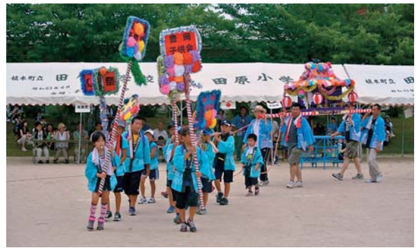
▲7月28日 「田原子どもみこし祭り」 毎年恒例の校区の祭りで37回目を迎えました