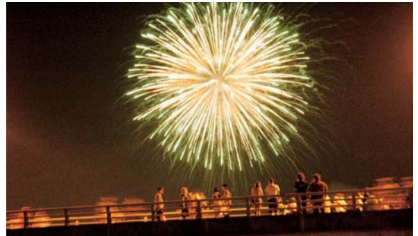
▲8月5日 「第29回 植木温泉納涼花火大会」 5,000発の花火が夜空を彩りました