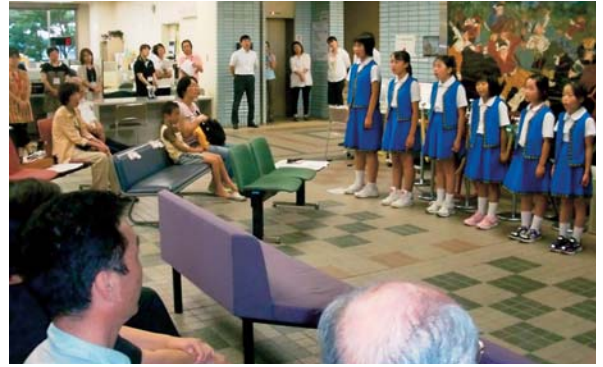
▲7月26日 北区役所ロビーコンサート ジュニアコーラスAnimatoの皆さんが きれいな歌声を届けてくれました