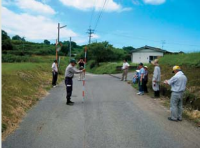
▲伊知坊地区での「まち歩き」の様子