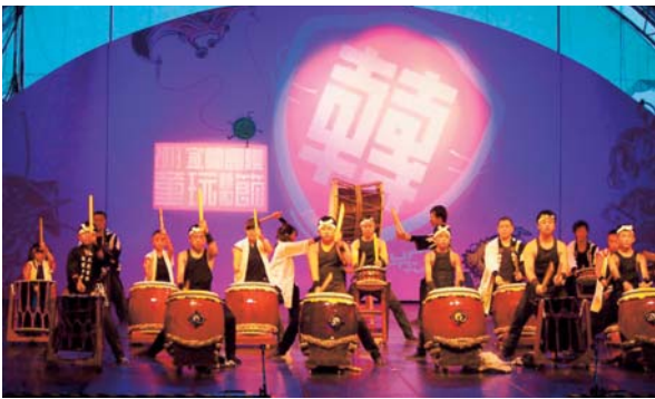
▲7月24日～8月2日 「国際民間文化芸術交流会台湾公演」 田原坂太鼓が日本代表として参加しました