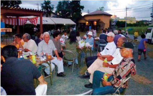
▲7月24日 植木校区にて「地藏まつり」と「夜市(まちづくり株式会社主催)」が開催されました