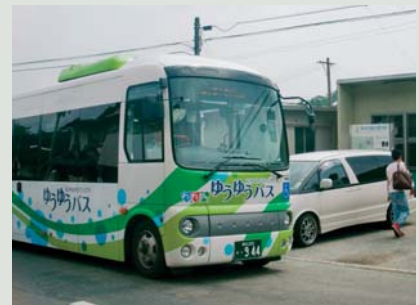
▲駅前のゆうゆうバス運行風景