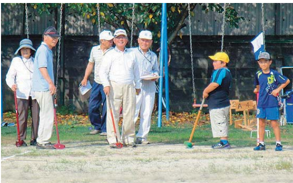
▲9月7日 山本校区老人会・小学生ふれあいグラウンドゴルフ大会 100名以上の参加があり楽しくプレイしました