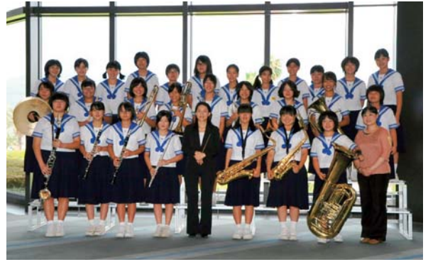
▲8月9日 第9回南九州地区吹奏楽コンテスト出場（県代表 五霊中学校吹奏楽部）