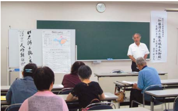
▲9月1日 教養講演会「加藤清正と熊本城本丸御殿」（植木公民館）