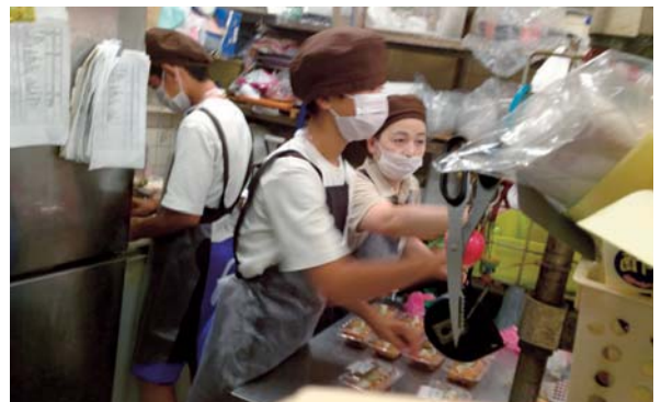
▲9月10日～13日 植木北中2年生職場体験（ヒライにて） 他2中学校でも同様の体験学習がありました