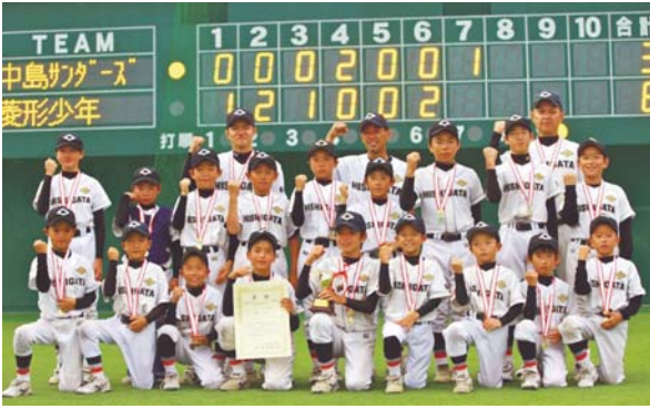
▲8月2日～4日 第33回九州ブロックスポーツ少年団軟式野球交流大会優勝（菱形少年野球クラブ）