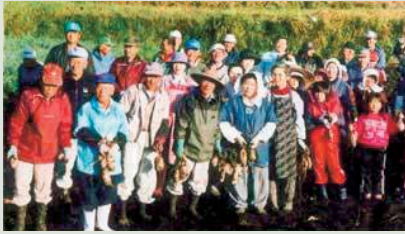
▲柳谷(やねだん)で環境保全型農業に取り組むみなさん