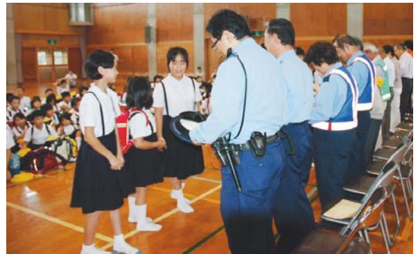
▲9月2日 植木小 見守り協力腕章伝達式 登下校の時間帯に地域の方々に腕章をつけてもらい あいさつを掛け合う地域を目指します