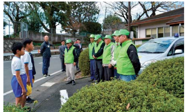
▲12月3日 山本校区 青色パトロール車 出発式 校区防犯協会と山本小の児童が参加し行われました