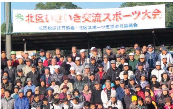
▲11月23日 北区いきいき交流スポーツ大会 (植木総合スポーツセンターにて)