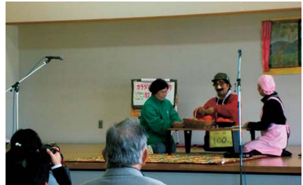
▲11月23日 寸劇「ふとださん家のスロー筋トレ」の一場面 北区男女共生会議で熊大の都竹教授の講演が ありました