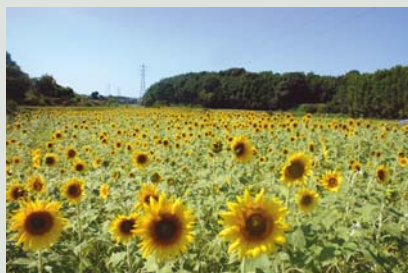
▲北区の花「ひまわり」 (吉松校区 大井地区)

部会は11月20日に開催し、平成26年度北区まちづくり推進事業とコミュニティセンター移行に向けた改修工事(植木・山東・吉松)の2件について協議を行いました。北区では、まちづくり懇話会で出された意見をもとに、25年度に実施した「北区花いっぱい事業」や「農産物の朝市」などの事業を継続することになりました。さらに、防災リーダーの育成など防災に関する新たな事業への取り組みなどについて検討されています。部会員からは、花いっぱい事業に関して、ひまわりの種の配布や休耕田の活用は大変望ましいことであるが、できれば配布される種が次の年も使えるような品種の検討をお願いしたいとの意見が出されました。