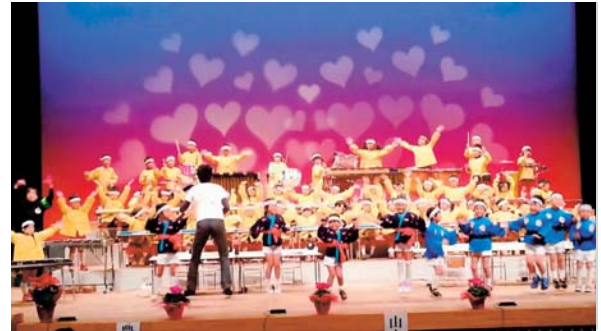
▲11月16日 第41回ちびっこ音楽会(公立4保育園) (植木町文化ホール)