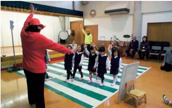
▲11月25日 田原児童園 交通安全教室