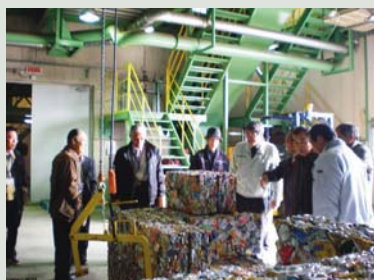
▲リサイクルプラザ現場(轟)