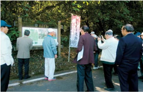
▲11月14日 田原坂顕彰会研修視察 ともに国指定を受けた玉東町の史跡を巡り説明 を聞きました