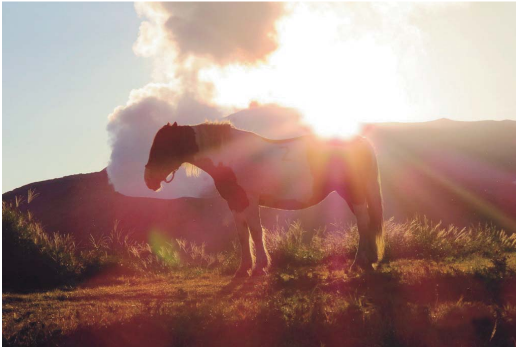
阿蘇高原の日の出

ホームページ： http://www.uekimachitokureiku.hinokuni-net.jp/