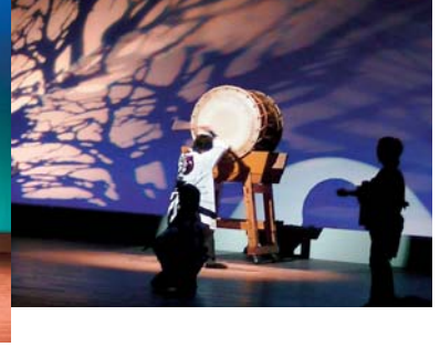
▲11月10日 植木町文化協会40周年記念 総合文化祭