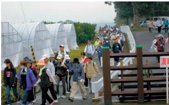
▲11月3日 田原坂ウォークラリー2013 (田原坂公園周辺)