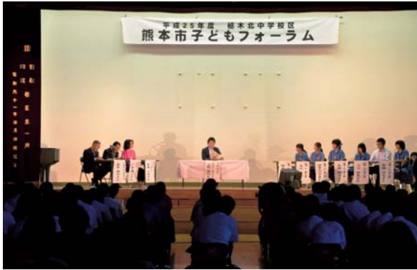
▲10月13日 熊本市子どもフォーラム (植木北中) 写真はパネルディスカッション風景 五霊中でも開催されました