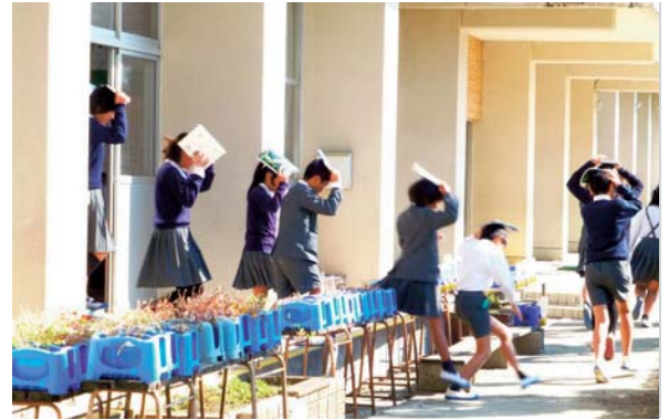
▲10月29日 吉松小学校 防災訓練 地震発生直後に給食室の出火を想定し 校庭に避難する児童