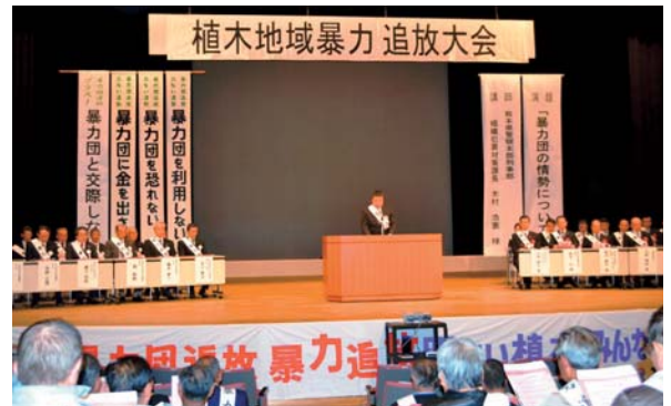
▲11月13日 植木地域暴力追放大会 (植木町文化ホールにて)