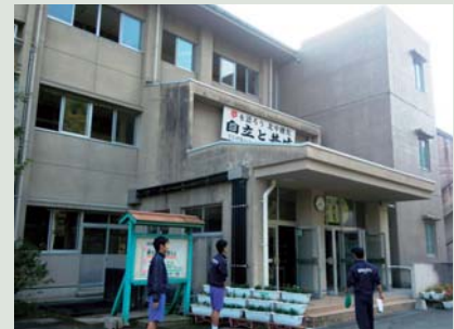
▲植木北中学校正面風景