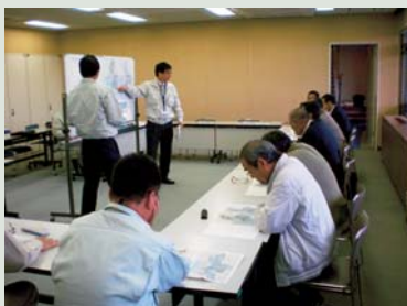
▲説明を受ける様子

11月7日、部会は合併時から平成25年度までの上水道の整備状況について、上下水道局より説明を聞きました。「安全でおいしい水道水の安定供給」のために、新市基本計画に基づいて整備が進められています。新市基本計画の総事業費は約38億円で、平成28年度完了予定。本年度の事業費は約9億5千万円で、植木全体で28ヶ所の工事が行われています。