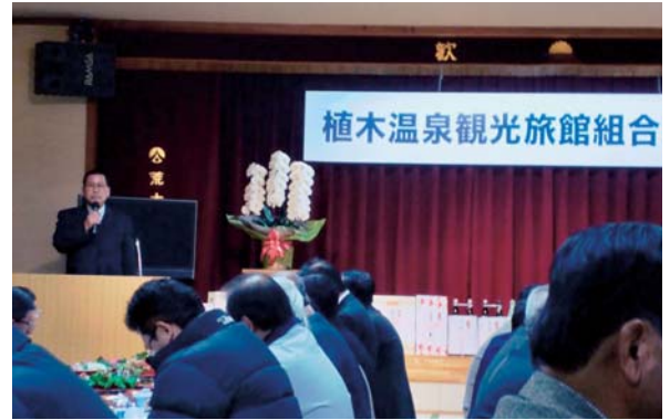
▲1月17日 植木温泉観光旅館組合新年会