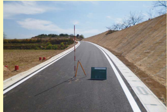
インター～有泉線 竣工