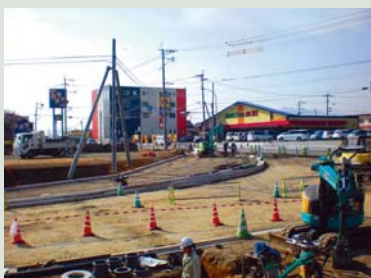
▲工事中の平田機工前交差点

部会は1月28日、植木温泉観光道路(慈恩寺～平島橋線)の改良計画と、都市計画道路 岩野～小山線の開通予定について主管課に説明を求めました。