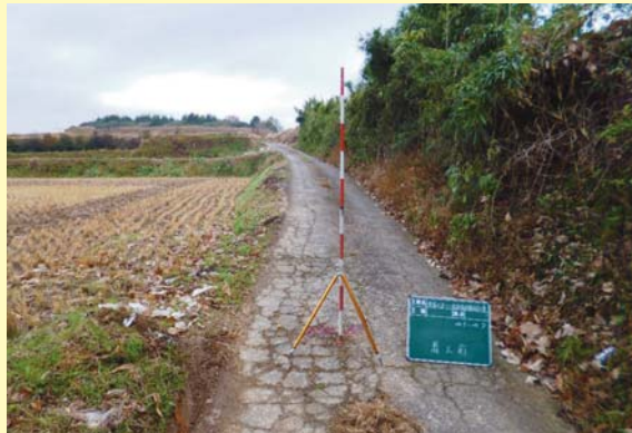
インター～有泉線 着工前

今後も地域の活性化と安全で暮らしやすいまちづくりを目指して取り組んでまいります。