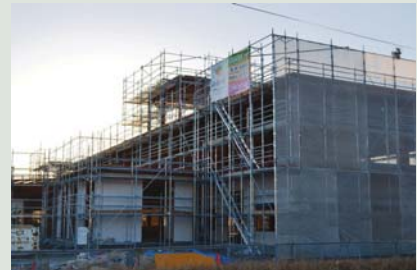
▲建設中の田原の郷