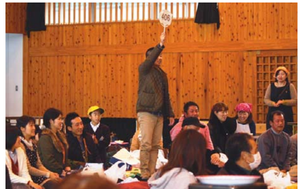
▲1月26日 報徳祭(山東小学校) 手づくり品を持ち寄る伝統行事で101回目となりました