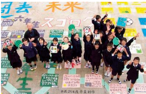
▲1月22日 山本小学校 巨大スゴロク贈呈式 卒業生17名が6年間の感謝を込めて卒業制作