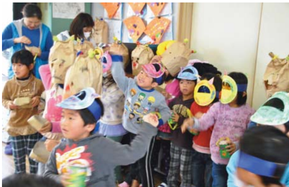
▲2月3日 町内の各園で恒例の豆まきが行われました。 (写真は田底保育園)