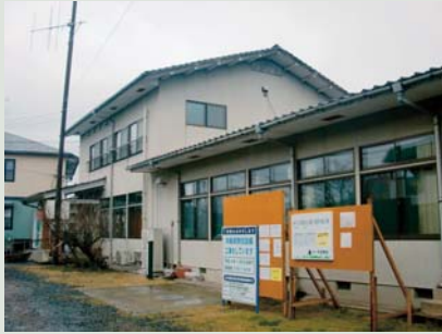
▲改修中の植木分館

部会は1月21日に開催し、コミュニティセンター移行に向けた公民館分館の改修計画について協議を行いました。植木地域では、本年度から菱形校区が従来の公民館分館から地域コミュニティセンターに移行し、地域づくりの活動の拠点として校区組織により管理・運営が行われています。また、4月からの移行に向けて植木・山東・吉松校区の各分館の改修工事が進められています。平成27年4月には残る5分館がコミセンへ移行することになりますが、改修工事をコミセン移行までに終了できないケースもあります。今後、26年度に桜井・田底校区、大和地区、27年度に山本・田原校区を改修する計画です。部会員からは分館を改修するための基準について質問があり、空調設備の改修など各分館の改修状況について説明がありました。