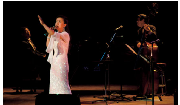
▲7月4日 STANDARD And JAZZ LIVE (植木町文化ホールにて)