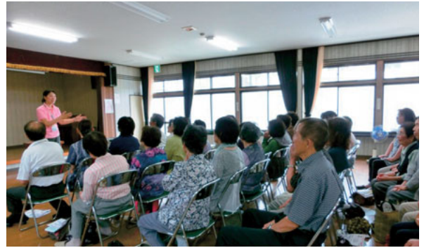
▲6月25日 植木校区健康セミナー 認知症予防の講話や実技体験が行われました