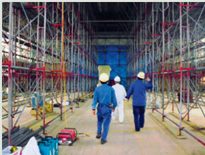
▲工事が始まった田原小体育館