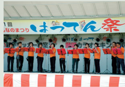
▲昨年のはってん祭の様子