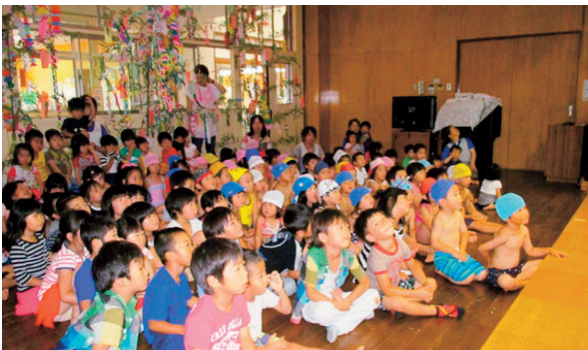
▲7月4日 七夕会 町内各園で七夕行事が行われました。 写真は豊田保育園の七夕会の様子