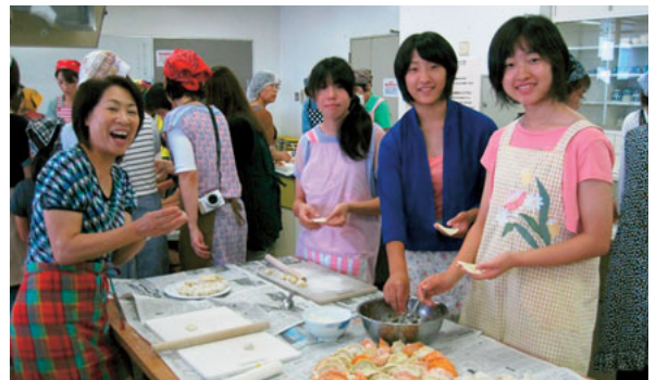
▲7月6日 平成26年度植木町国際交流協会ミ二交流会 留学生を講師に本場中国の水餃子づくりで 賑わいました

【訂正】7月号「まちのわだい」で掲載した消防操方・県大会の日程を8月2日と掲載しておりましたが、3日の誤りです。お詫びして訂正します。