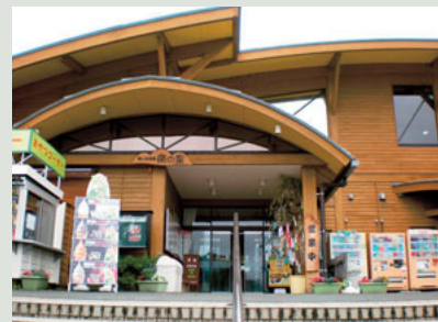
▲俵山交流館「萌の里」