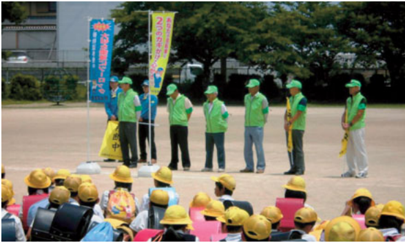
▲6月9日 桜井校区防犯協会 防犯パトロール出発式 山鹿警察署、校区関係者が参加し行われました