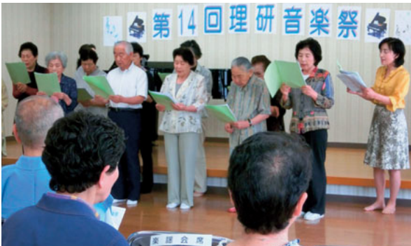
▲6月28日 理研音楽祭(植木地域コミュニティセンターにて) 理研先生寄贈のピアノを使った住民手作りの音楽祭が 14回目を迎えました