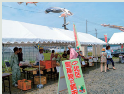
▲ 5月開催の北区農産物の朝市(春季)