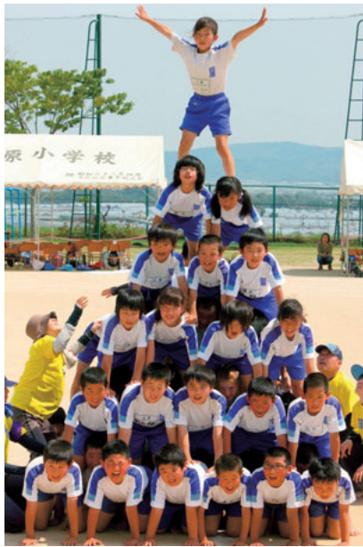
▲5月24日(土) 田原小学校 運動会(組体操) 町内の6小学校にて運動会が開催されました