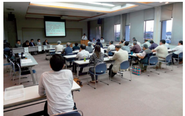
▲5月27日(火) 桜町再開発事業(MICE施設等)説明会 (植木文化センター多目的ホールにて)