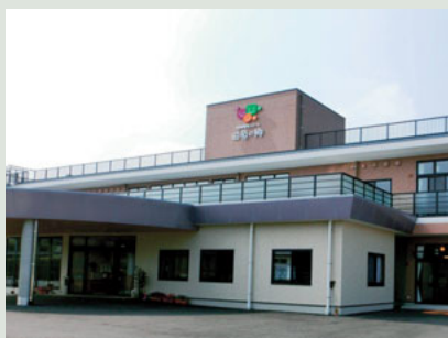
▲完成した特別養護老人ホーム「田原の郷」

急激に進む高齢社会、私たちは、これからを真剣に考えていく必要があると考え、部会では今後もさまざまな情報発信に努めてまいります。