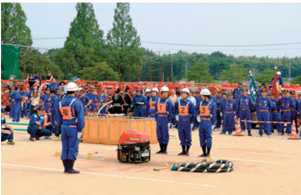
▲6月8日(日) 熊本市消防操法大会 豊田消防団が準優勝。8月2日に開催される 県大会(人吉)に代表として出場します