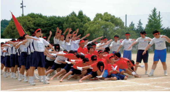
▲5月18日(日) 植木北中学校 赤組応援合戦 町内3中学校にて体育大会が開催されました