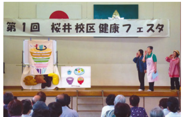
▲6月15日 桜井校区健康フェスタ 食育演劇 第1回フェスタが桜井校区自治協議会主催で 盛大に開催されました