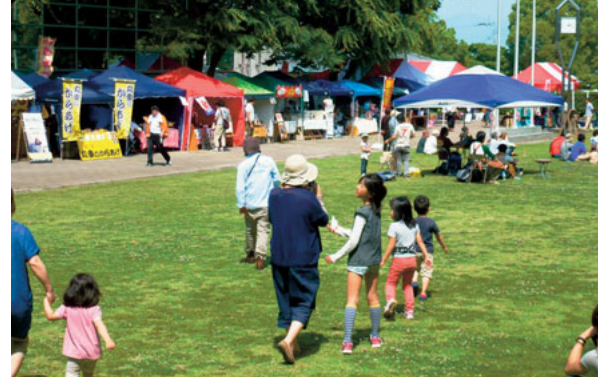
▲5月18日(日) 北区農産物の朝市(春季) 当日は第44回Uekiもんマルシェも 開催されました