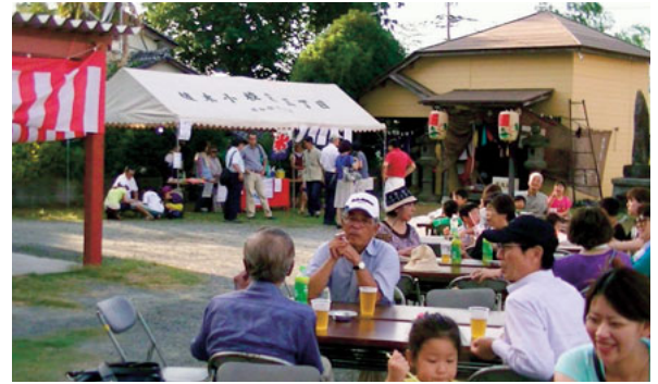
▲7月24日 植木お地蔵さん祭り ギターのミニライブや屋台もあり賑わいました