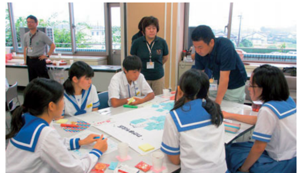
▲8月5日 北区マップづくり中高生ワークショップ 中高生を対象に北区の宝物を掲載したマップづくり ワークショップを区役所で開催