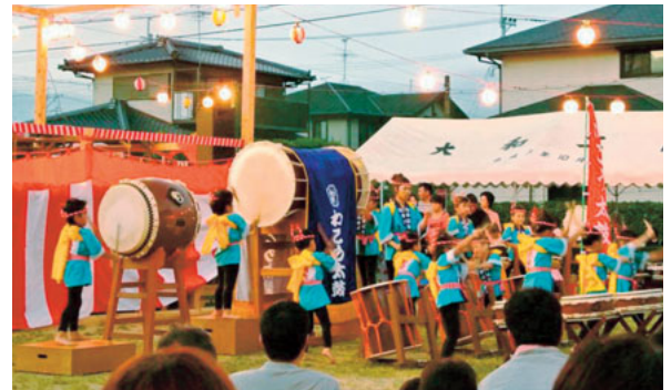
▲7月26日 大和地区夏祭り 子ども達のダンスや太鼓演奏などで盛り 上がりました