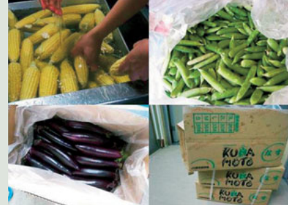
▲調理場に並ぶ食材