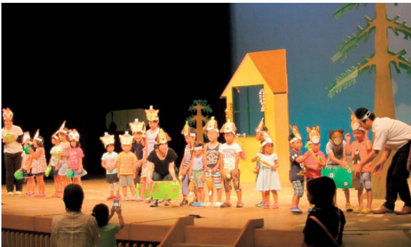
▲7月26日 植木図書館「親と子のお楽しみ会 サマースペシャル」 写真は参加型人形劇プレーメンの音楽隊の一場面