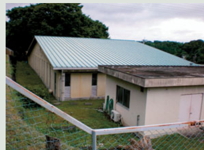
▲大和地区污水处理施設