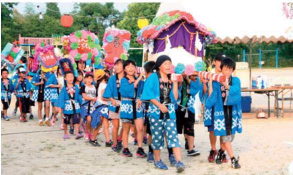
▲7月27日 田原子どもみこし祭り 毎年恒例の祭りで38回目を迎えます