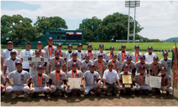
▲7月5～23日 県選手権優勝 城北高校甲子園へ！ 植木出身の選手たちも活躍