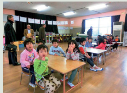
▲田底保育園の園児達