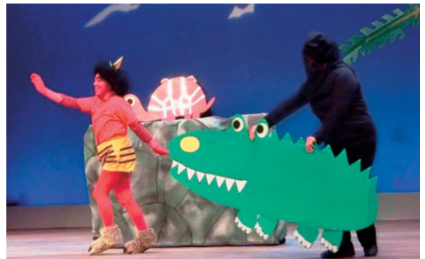
▲1月11日 親と子のお楽しみ会 お年玉スペシャル 「赤鬼さん、まだ節分じゃないんだけど…」の一場面