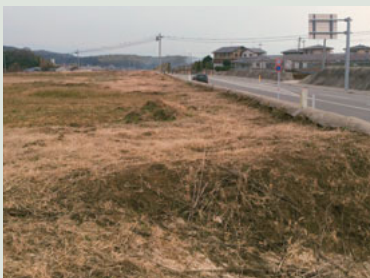
▲建設用地(岩野地内)

部会は12月8日に開催し、植木地域振興のための主要事業の一つである農産物の駅(仮称)計画の進捗状況について、市の担当者から説明を受けました。