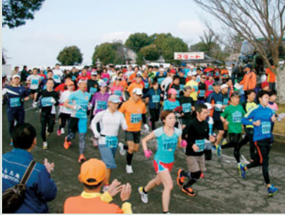
▲昨年のマラソン大会風景

部会は12月19日に開催し、第46回田原坂健康マラソン大会や植木駅の無人化計画の撤回を求める要望書の提出など4件について協議を行いました。