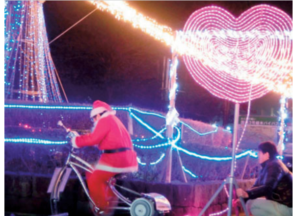
▲12月20日 北区キラキラ大作戦イルミネーション点灯式

第18回熊本県中学生アイデアロボットコンテスト大会に植木北中から3チームが出場し、準優勝、3位・敢闘賞、ベスト16に輝きました。そのうち、九州大会に出場したチームが準優勝し全国大会へ出場します！