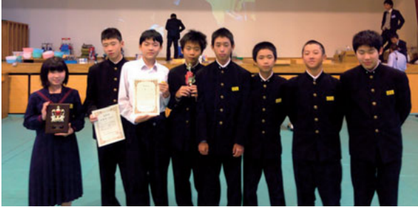
▲12月6、7日 植木北中生徒、創造アイデアロボットコンテスト 1/24、25日の全国大会(東京)授業内部門に出場

第18回熊本県中学生アイデアロボットコンテスト大会に植木北中から3チームが出場し、準優勝、3位・敢闘賞、ベスト16に輝きました。そのうち、九州大会に出場したチームが準優勝し全国大会へ出場します！