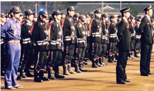
▲12月28日 消防団第15・16方面隊年末警戒出発式