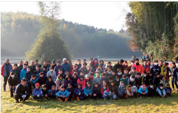
▲1月11日 田原小どんどや