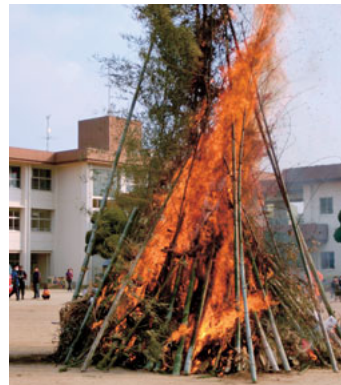
◀1月10日 植木小どんどや