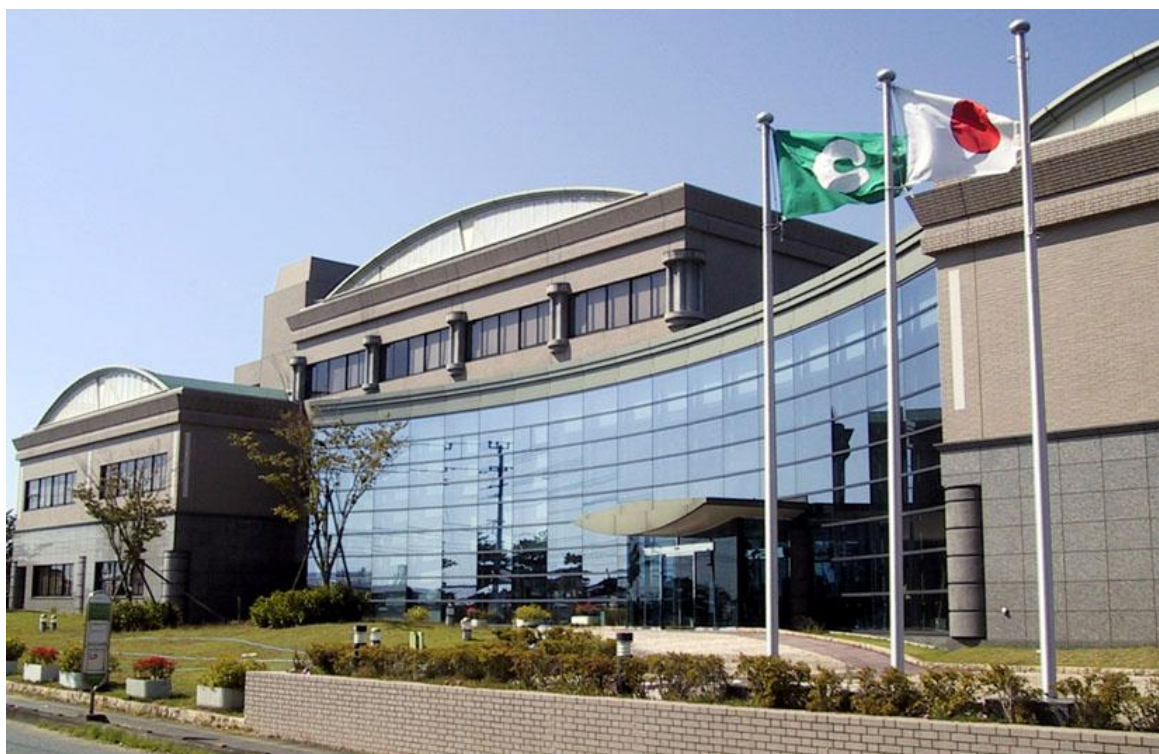
熊本市環境総合センターの全景