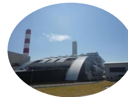
せいぶかんきょうこうじょう 西部環境工場