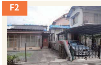
〈ブロック塀が倒壊、屋根も被害〉 梅雨を前にどの家もブルーシートをかけてしのいだ。