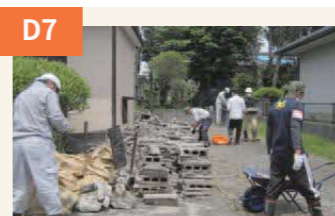
〈神戸から駆け付けたボランティア〉 阪神大震災の被災地である神戸から、ボランティアが駆けつけてくれた。