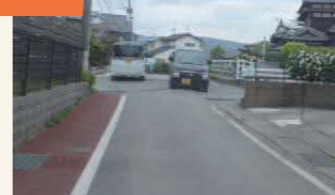
〈秋津小近くの道路には大きな段差〉 こうした光景は町内のあちこちで見られた。