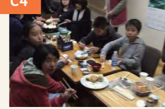
〈秋津老人憩の家で炊き出し〉 ガス、電気が止まる中での温かい食事はありがたかった。