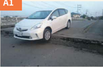
〈上沼山津橋で段差に立ち往生の車〉