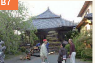
〈倒壊前の浄福寺〉 戦国時代からの歴史を誇る浄福寺も本堂・鐘楼が全壊した。