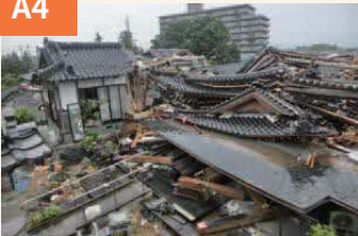
〈跡形もなく崩れ落ちた家並み〉 地震では瓦の重さがあだとなった。