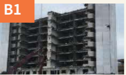
〈被災したマンションの解体〉