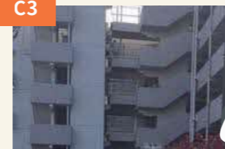
〈通路部分が分離したスカイハイツ健軍東〉 廊下が分離するなど大きな被害を受けた。