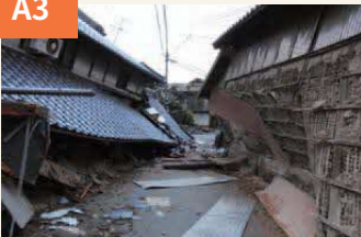
〈大破した家が道路を埋めた〉 本震翌日の沼山津4丁目付近。