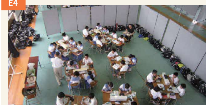
〈校舎が大破した東野中は体育館を教室に〉 事前に校舎の耐震補強は行われていたが、耐えきれずに大破。校舎完成は4年後。