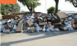
〈ごみであふれ返った老人憩の家前〉 家庭で保管するよう「後日集めます」が何カ所も書かれている。