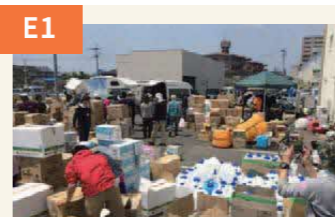
〈ボランティアが配給物資の整理〉 東野1丁目の駐車場では全国から寄せられた支援物資の仕分けに追われた。