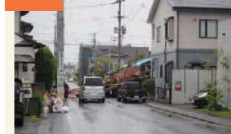
〈倒壊した家屋が通りをふさいだ〉 秋津川から離れるほど地盤は安定したが、一部の家屋は倒壊し、通りをふさいだ。