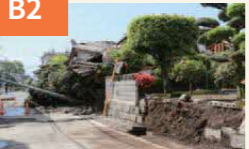
〈道路をふさぐ電柱と倒壊した家屋〉