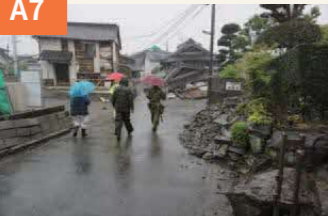
〈光輪寺の周辺〉 本震から6日後の21日、災害復旧に派遣された自衛隊を受け入れるため、専任下士官を自治会長と副会長が案内して被災地を回った。