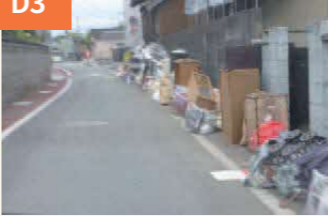
〈ごみは片側に寄せて〉 片側に寄せたことで、緊急車両も安全に通れるようになった。