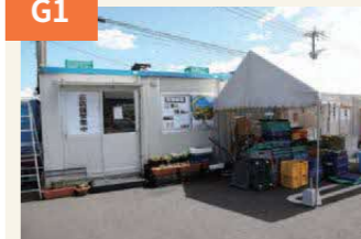
〈スーパーも仮設店舗で営業〉 秋津レークタウンのスーパー「マルミヤストア」も駐車場内の「仮設店舗」で営業。