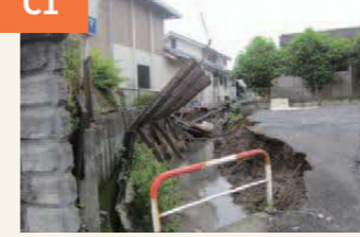
〈大きく崩れた排水路〉 駐車場のカーポートが崩れ落ちた。