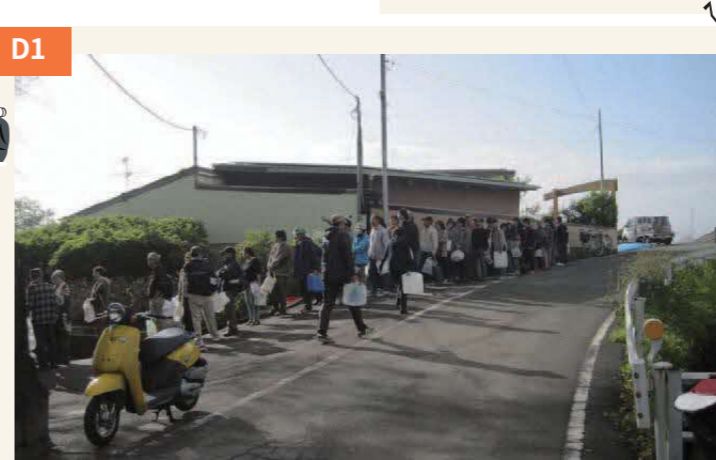
〈中無田神社に水汲みの列〉 地震直後は全域で断水。湧水が豊富な中無田神社には、飲料水を求めてタンクを抱えた人が長い列を作った。4月19日撮影。