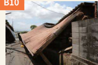
〈小屋が両側から倒壊〉 両側から倒れ掛かり、道路を完全にふさいだ。