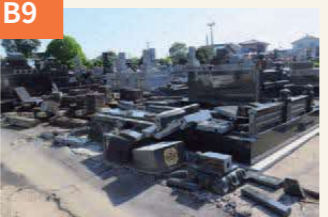
〈墓石も宙に舞う〉 重い墓石が周囲に「散乱」していた。