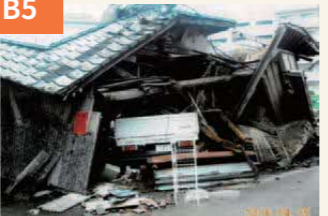
〈大破した小屋とトラック〉 小屋がトラックもろとも押しつぶされた。