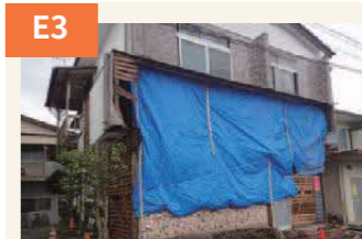
〈壁面が大破した住宅〉 塀が倒れたり壁が落ちるなど、各所で大きな被害を出した。