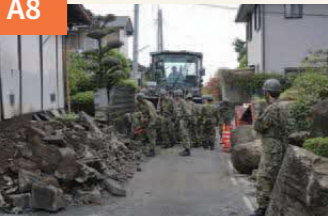
〈自衛隊派遣〉 写真は22日の道路復旧作業。道路が通れるようになったのは被災地には何よりの光明。雨の中、缶詰一つで頑張っていた。