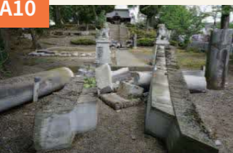
〈大破した沼山津神社〉 大きな鳥居は跡形もなく倒壊。再建された鳥居は、旧来の石の土台に継ぐかたちで、笠木など上部は木製で再建した。