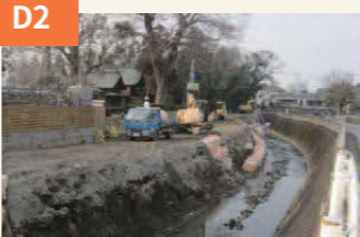
〈鶯川の護岸工事〉 鶯川の取付道路護岸が傷んだため復旧工事が行われた。撮影は地震から10か月後の翌年2月。