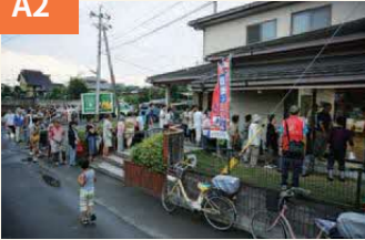
〈いち早い支援物資に行列〉 本震の16日午後6時ごろの秋津1町内公民館前。各方面からの支援や炊き出しが力となった。