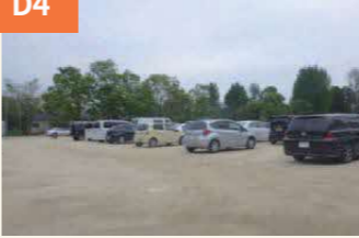
〈秋津小学校に避難してきた車中泊の車〉 秋津小では、運動場には多くの車中泊の車が詰めかけた。