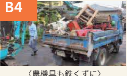
〈農機具も鉄くずに〉