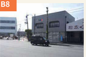
〈封鎖された沼山津入口の交差点〉 家屋の倒壊で通れず封鎖された。