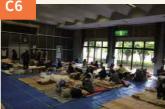
〈秋津まちづくりセンターも大きな被害〉 避難所には近くの人が着の身のままで避難してきた。