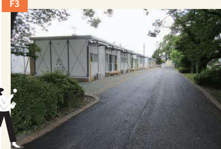
〈秋津中央公園に仮設住宅〉 プレハブの54戸が作られ7月5日に入居が始まった。避難所などでの不便な生活から解放された。1DK、2DK、3Kの3タイプで、集会所も整備された。民間アパートも「みなし仮設」として使われた。