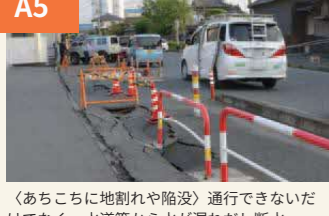
〈あちこちに地割れや陥没〉 通行できないだけでなく、水道管から水が漏れだし断水。