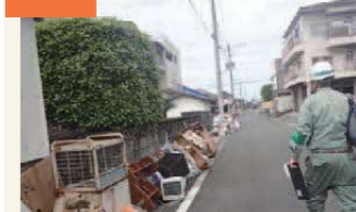
〈被害状況を調査する職員〉 調査には全国の自治体から職員が応援に駆け付け、1軒1軒調査して回った。