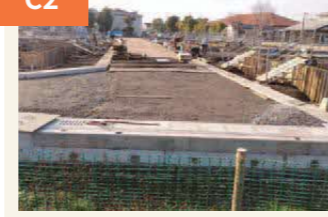
〈復興住宅の建設始まる〉 地震から3年後の2019年1月。旧秋津浄化センター跡の一角に、復興住宅の建設が始まった。