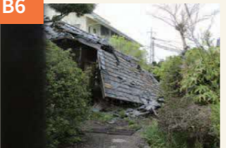
〈四時軒も跡形なく全壊〉 地盤の特に弱い川沿いとあって跡形もなく倒壊。