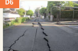
〈道路には大きな地割れができた〉 道路の中央に配水管が走るため、地震の揺れで陥没。秋津1丁目の道路には長さ100mにわたって長い亀裂が生じた。