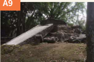
〈小楠公園も大きな被害〉 地区のシンボルである小楠公園の横井小楠公像は台座から外れ地面に落ちた。