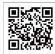
技能習得講座申込