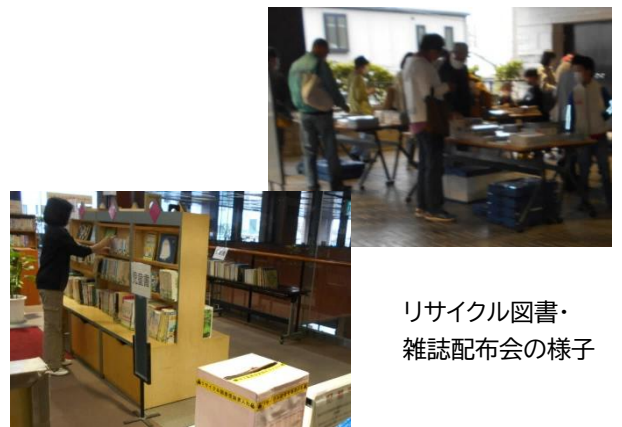
リサイクル図書・雑誌配布会の様子