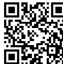
加点書類提出フォーム

③ 改姓等で志願書と免許状の氏名が異なる場合は、改姓が証明できるもの(戸籍抄本等)を添付して提出すること。