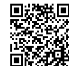
かんこくごばん 【韓国語版】

https://www.kumamoto-waterworks.jp/?waterworks article=2615