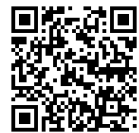
ちゅうごくごばん 【中国語版】

https://www.kumamoto-waterworks.jp/?waterworks article=2614