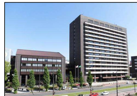
写真_熊本市役所本庁舎

都市安全課の執務室は、3月24日から本庁舎の11階に移転します。 来課される際はご注意ください。 ※電話番号の変更はありません