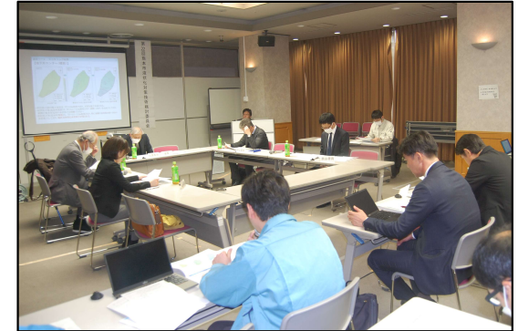
写真_委員会の様子

①⑦地区について、追加工事を実施したことで地下水の低下が確認されたため、地下水位低下完了の承認をいただきました。今後、1年間の経過観測期間に移行します。