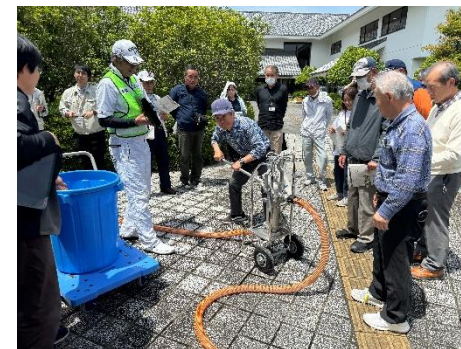
写真1.手押しポンプ使用状況の様子