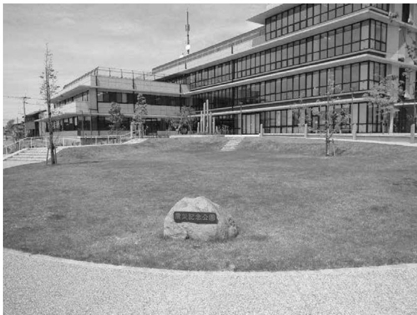
益城町「震災記念公園」(令和5年6月竣工)