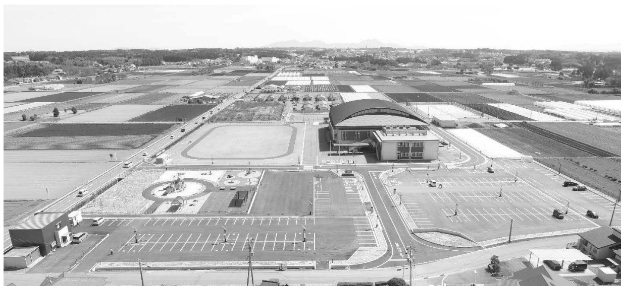
西原村総合体育館