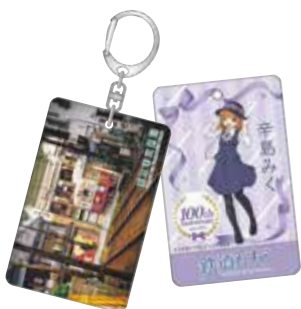
アクリルキーホルダー