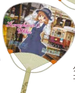
グッズ購入は、 コチラ