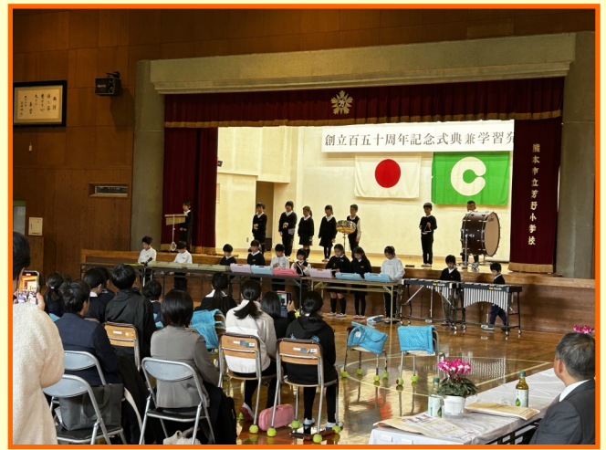
（2部の学習発表会の様子）