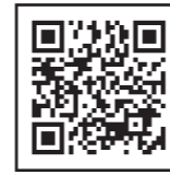
熊本市ホームページ

優先度が高い方においては、ケアマネジャーや相談支援専門員等の福祉専門職にご協力いただき、段階的に計画作成を進めていきます。優先度が高い方には、市から計画作成の同意確認を行います。ご同意いただいた方の計画作成を、担当の福祉事業者へ委託を行い、計画作成を進めていきます。優先度が高い方の条件は、熊本市ホームページ(二次元コード)からご確認ください。