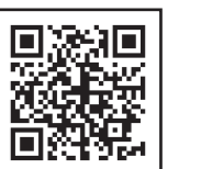
熊本市防災情報ポータル

「熊本市防災情報ポータル」で緊急情報、避難情報、気象情報、避難所開設情報などを公開しております。