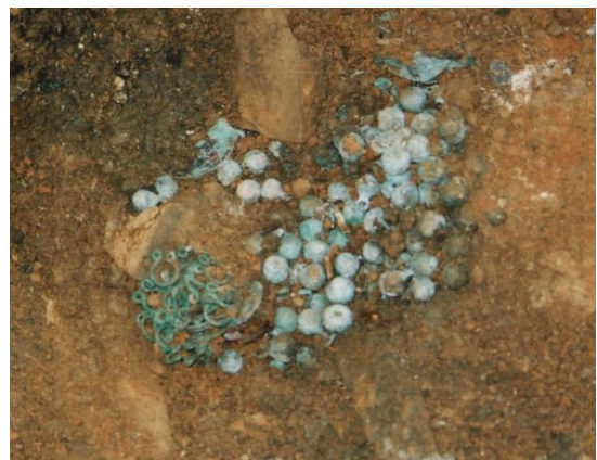
裏足ボタン出土状況