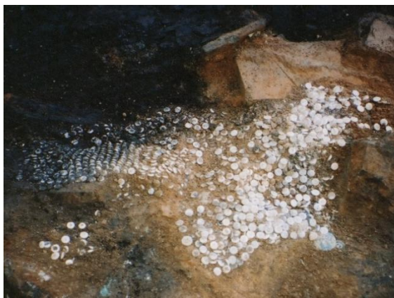
表穴ボタン出土状況