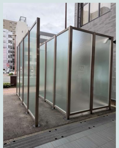
パーティション型