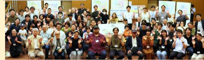
R7市民ワークショップ

新庁舎整備について、積極的な情報発信、オープンハウス、ワークショップ等を実施することにより、市民意見を踏まえながら検討を進めます。