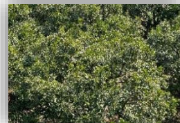
次の花が咲く準備をする