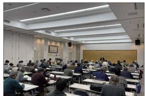
西南戦争歴史講座の様子

課題としては、「西南戦争歴史講座」における参加者の多くが熊本市(旧植木町)・玉東町・玉名市とその近郊の在住者であり、その他の地域や熊本県外からの参加者が伸び悩んでいる点が挙げられる。県外在住者に関しては、SNS(ソーシャル・ネットワーク・サービス)等の反応から一定の関心を持たれていることは把握できるものの、遠方のため現地へ訪問することができない等の理由から受講者の増加には至っていない。また、受講者の多くは65歳以上の高齢層であり、若年層や所謂ライト層(西南戦争を学び始めたばかりの人、あるいは西南戦争をこれから学びたい人)への働きかけも難航している状況にある。