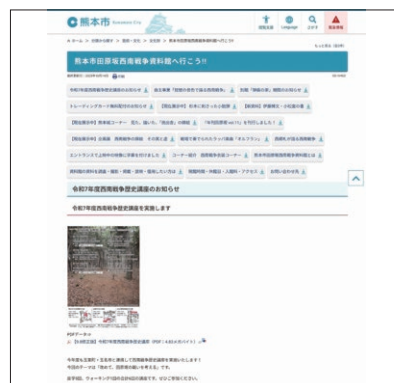
『熊本市田原坂西南戦争資料館へ行く!』HP（部分）

課題としては、上述したデジタルコンテンツでの情報発信が、やや弱い点が挙げられる。