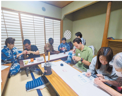
和裁の見学や手作りのお手玉遊び

東部まちづくりセンター・公民館では、地域の方や外国人住民を含め、誰もが安心して暮らせる多文化共生のまちづくりを進めており、今後も交流の機会をさらに広げていきます。来年度の交流イベントもぜひ楽しみにしてください！地域の皆さまの参加もお待ちしております。