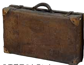
八雲愛用のトランク