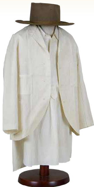
八雲愛用のスーツと帽子