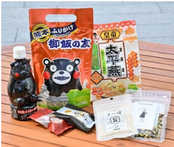
熊本市 商品イメージ(当日販売のない商品も含まれます)