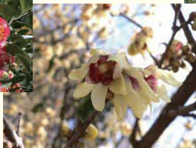
①ロウバイ ②2月中旬～3月中旬