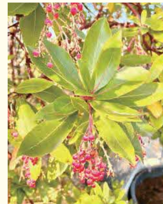
①ストロベリーツリー ②1月