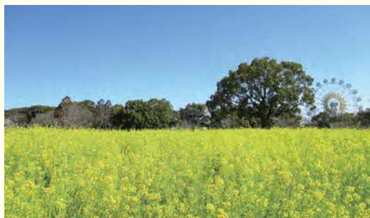
①菜の花 ②3月上旬～3月下旬