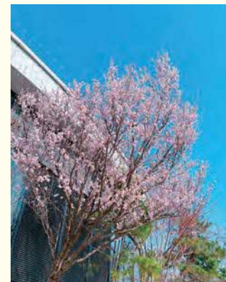
①河津桜 ②2月下旬～3月中旬