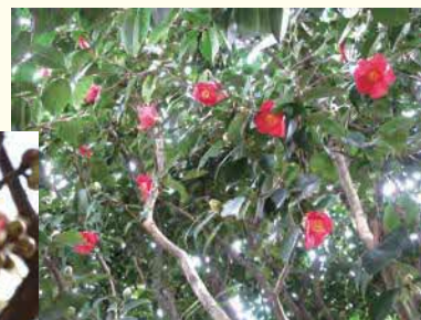
①ヤブツバキ ②2月中旬～3月中旬