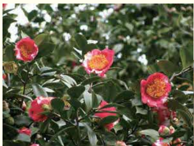
①肥後椿 ②2月中旬～3月中旬 前頁も参照を♪