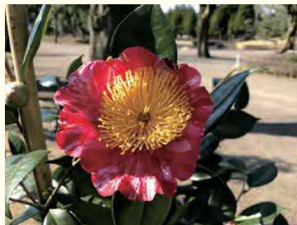
①肥後椿 ②2月中旬～3月中旬