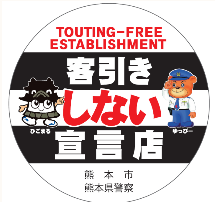
[宣言店ステッカー]