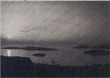
레프카다섬의 석양 Sunset on the island of Levkas