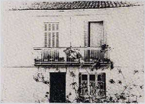
헨의 생가 그리스 레프카다 The house on Levkas where Hearn was born