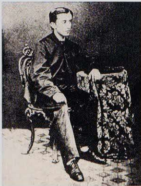
13세경의 헨 성 커스버트 칼리지 시절 At St. Cuthbert's, age 13 or 14

작은할머니의 파산으로 학교를 그만둔다. AGE 17 Withdraws from St. Cuthbert's due to Aunt Sarah's financial collapse