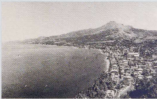
마르티니크섬 생피에르항 Saint-Pierre, Martinique

프랑스령 서인도 제도로 여행을 떠난다. 특히 가장 마음에 든 마르티니크섬에서 2년 가까이 지낸다. AGE 37 Travels to the French West Indies and spends nearly two years in Martinique