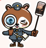
景観発掘プロジェクト 『みつけ隊』隊長 タヌキの洗馬くん