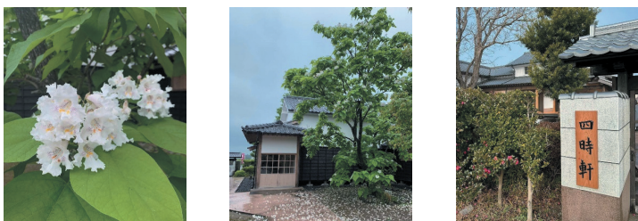
(秋津まちづくりセンター ☎368-2200)

歴史を受け継ぐ木と、未来へ残る新しい門標。季節の風が心地よい時期、四時軒をゆっくり歩けば、東区に積み重ねられてきた時間の流れを感じていただけるはずです。