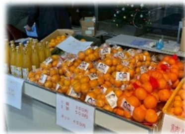
▲朝市マルシェのイメージ