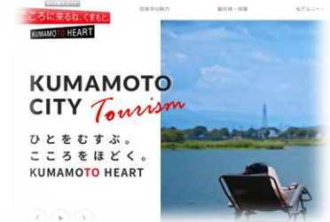
▲熊本市観光ガイド