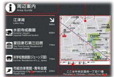
▲観光案内サインの改修（イメージ）