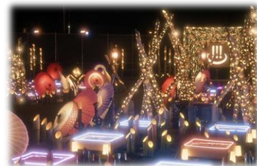
▲UekiArtSpa 植木温泉 湯幻灯 (植木温泉ライトアップイベント)