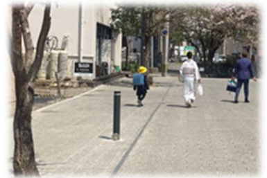
▲舗装高質化のイメージ