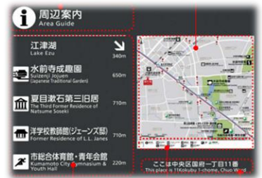
▲観光案内サインの改修（イメージ）