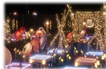
▲UekiArtSpa 植木温泉 湯幻灯 (植木温泉ライトアップイベント)