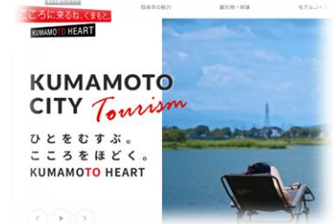
▲熊本市観光ガイド