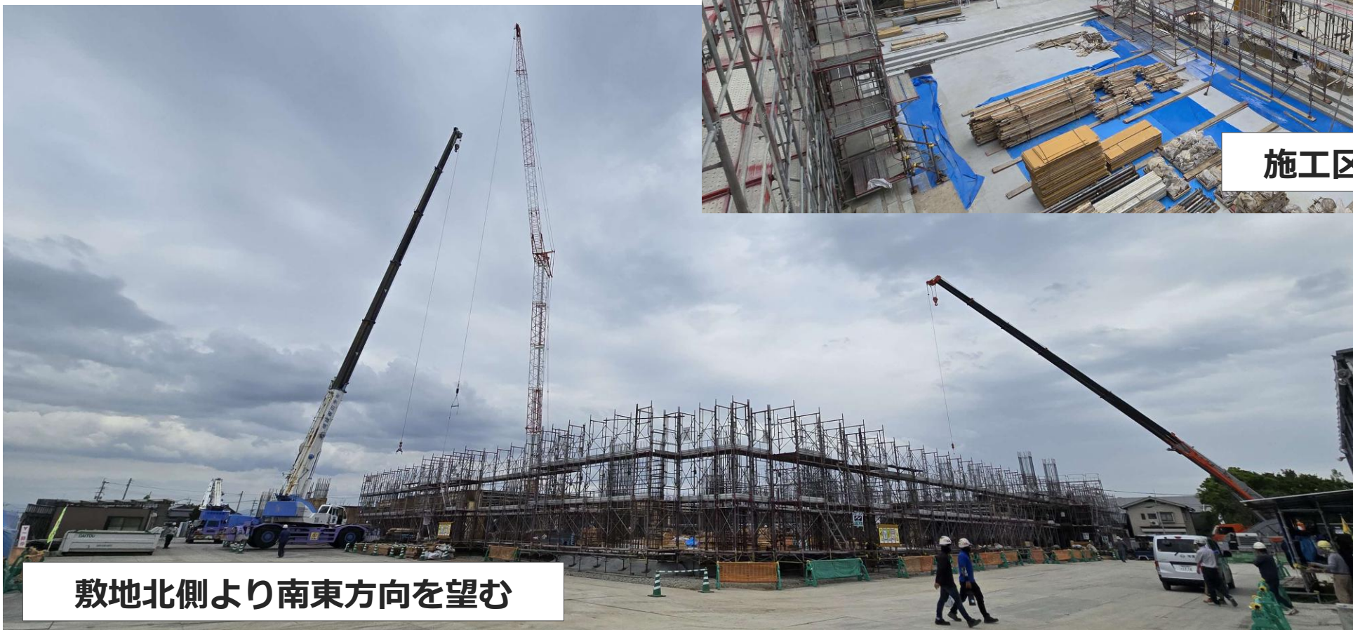
敷地北側より南東方向を望む