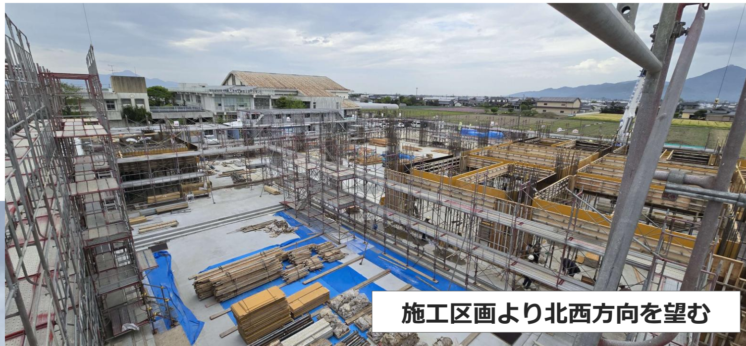
施工区画より北西方向を望む