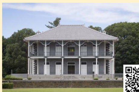
洋学校教師ジェーンズ邸