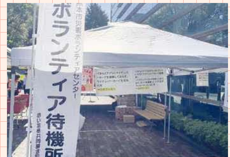
防災関連活動 地域の防災活動 (避難訓練、震災対処訓練など)