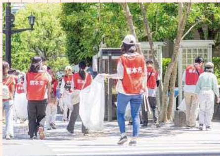
環境美化活動 各校区で行う清掃活動、除草活動など