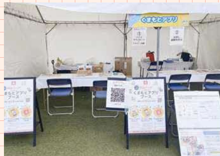
イベントの運営 当日のお祭りの企画から、事前準備、当日の運営など