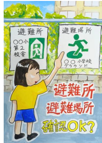
2025年熊本市防災協会長賞 受賞作品