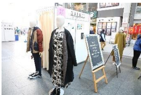
【展示ブースの様子】