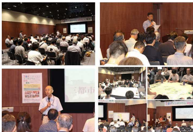
金沢・熊本・岡山まちづくりシンポジウム in 熊本 (平成27年9月)

令和元年9月、経済産業省「地域まちなか活性化・魅力創出支援事業」に採択された「回遊行動モデル構築・分析事業」にて、回遊行動モデルを構築し桜町再開発施設の開業後の来街者の回遊行動・消費行動が中心市街地に与える効果を予測・分析し、中心市街地全体を活性化に繋がる各種施策の提案を行った。