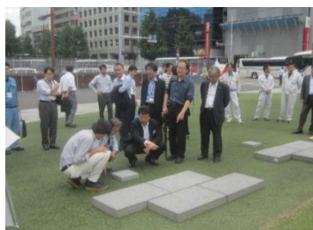
現地モックアップ