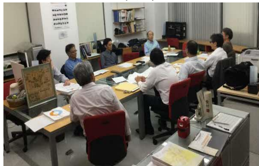
30年後の熊本市中心市街地の グランドデザイン策定WG