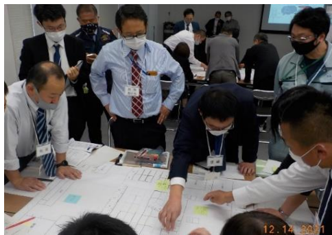
令和3年度 災害図上訓練