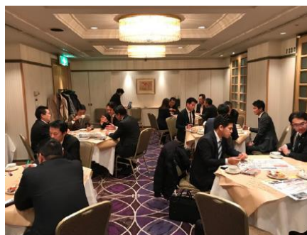
熊本駅周辺の将来像を考えてみよう！ ワークショップ