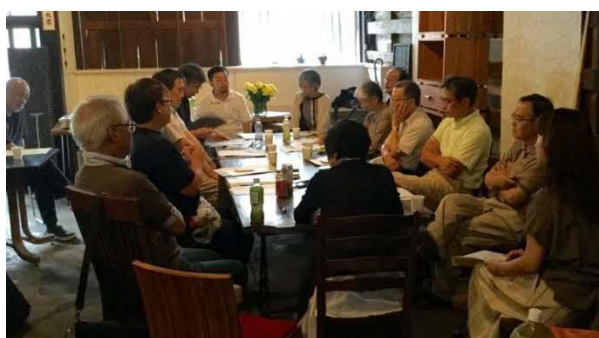
熊本まちなみトラスト会員総会(6月18日)

令和4年5月には、町屋等の歴史的資源の保存・活用や地区の魅力発信に向け、地元まちづくり団体との連携体制を強化し、各事業を推進するための「歴史的風致維持向上支援法人（歴まち支援法人）」に指定されたことから、新町・古町地区において、風情ある街並みや景観に配慮した城下町の魅力あふれるまちづくりへの寄与が期待されている。