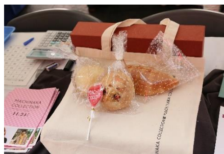
【販売ブースの様子】