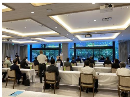
令和4年度 通常総会