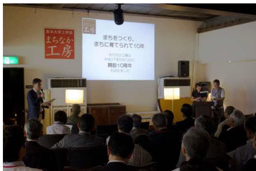
まちづくり学習会開催 100回記念まちづくり懇談会

このように、まちづくりに関する学術的研究や学生に対するまちづくり技術教育、まちづくりに向けた組織連携の核として、中心市街地におけるまちなか工場の役割は確立されつつあり、今後も地域貢献、地域連携に向けた取り組みの効果は確実に発揮されていくことが期待されている。