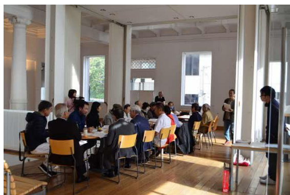
被災文化遺産所有者等連絡協議会 設立総会(11月12日)