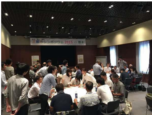
第7回金沢・岡山・熊本三都市 シンポジウム