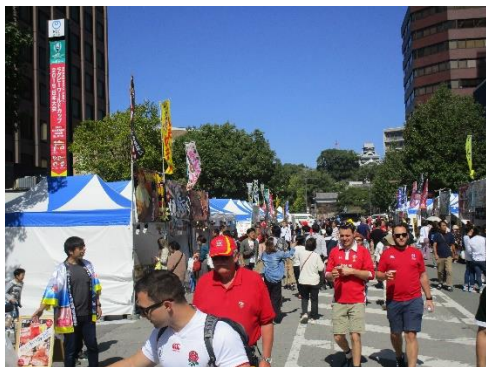
城下町大にぎわい市