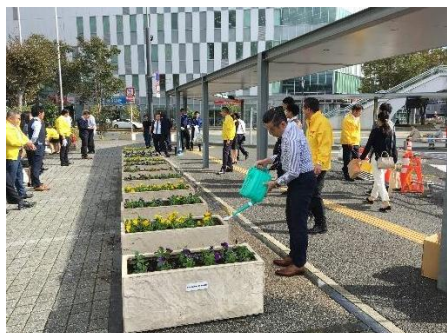
花いっぱい運動及び清掃活動

令和2年度からは新型コロナウイルス拡大の影響により、活発な活動が難しかったものの、令和3年3月に熊本駅白川口駅前広場の完成や、4月のJR熊本駅ビル（アミュープラザくまもと）の開業を受け、令和4年度は、清掃活動やイベントの実施、冬季イルミネーション事業等を計画しており、今後の熊本駅周辺地域のにぎわいの創出への寄与が期待されている。