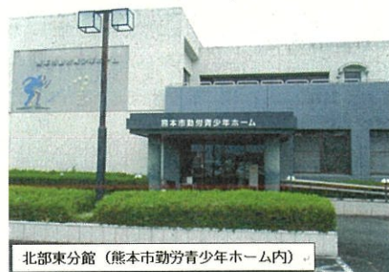
北部東分館(熊本市勤労青少年ホーム内)

また、「家庭教育学級」では、小中学校の保護者の皆さんの子育てに役立つ体験活動や研修会などを行っています。どの講座も皆さんが意欲的に楽しく学べるものばかりです。ぜひ、積極的にご参加ください。北部東分館は、これからも皆さんが気軽に集まり、意欲的に学び続けられる公民館を目指します。ご来館を心よりお待ちしております。