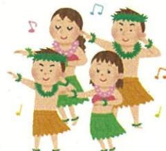
はじめてのフラダンス