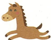
粘土を使って干支の「午」を作ろう