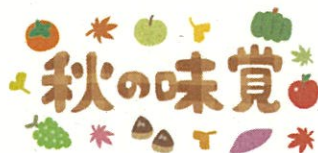
ハートフル家庭料理「秋を楽しむ」