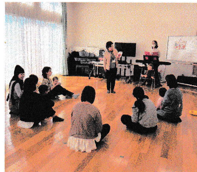
ニッキースマイルクラブ