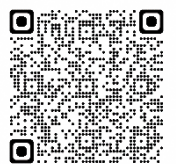
ヘルプマークに関する