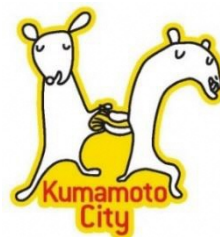
熊本市障がい者サポーター制度シンボルマーク