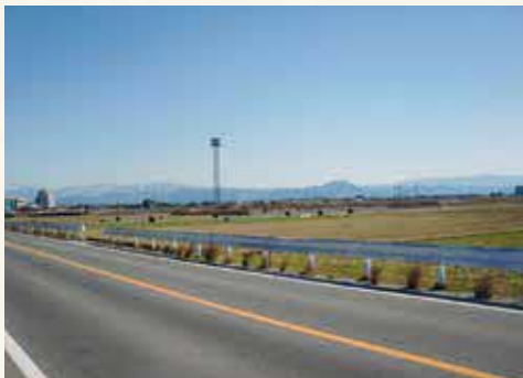
県道 236 号からの景色

近年は、東バイパスや県道の改良等で急速に住宅地として発展しましたが、まだ、のどかな田園風景も残っています。散策しながら、温泉や公園、史跡など、ゆっくり癒しの時間をお楽しみください！