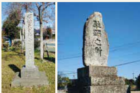
明治天皇御幸御野立所