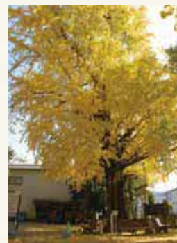
笛田神社のイチヨウ

笛の上手な神様が笛を投げ、里人がその笛をご神体としてお祭りしたのが創まりとされています。神社内には、樹齢約500年と推定される熊本市指定保存樹の大イチョウがあり、秋の黄葉はとともきれいです。