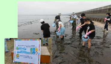
熊本市西部浄化センターを会場に干潟再生を目的とした「海をきれいに！わくわくSDGs体験会」