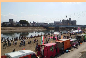
熊本駅前フェスタの一環として、開催する一大イベント「西区フェスタ」。来場者数約1万3千人