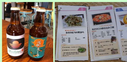
東海大学と連携し、作成した芳野のブラッドオレンジを使ったクラフトビール「芳野えーる」とスローフードレシパードなどの作成