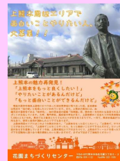
上熊本周辺エリアのにぎわいづくりのためのまちづくり団体の立ち上げ・支援