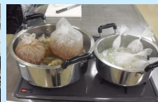
少量の水でできるバッククッキング地域講習会・体験会