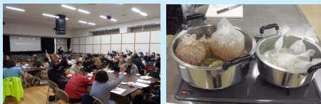
地域防災リーダー（防災士）研修での避難所運営グループワーク等の講座