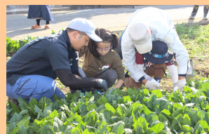
地元の農水産物等の地域の資源を活かした子どもたちの「キャベツの収穫体験」