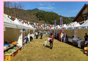
金峰森の駅みちくさ館を活用し、地域の特産物を販売する「きんぼうマルシェ」