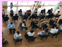
少子高齢化などの解消のため有明海沿岸・金峰山系エリアが連携して取り組む「婚活事業」