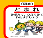
交通安全対策キャラクターシート