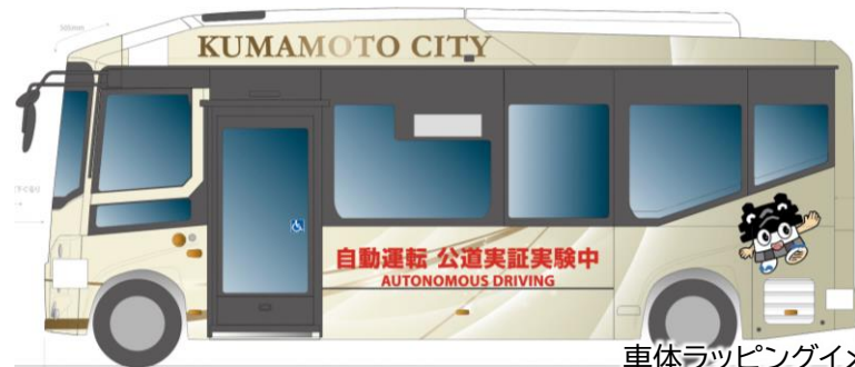
車体ラッピングイメージ